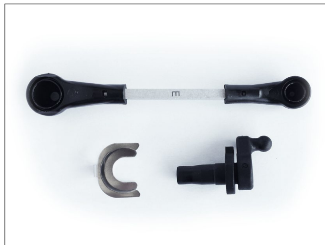
2. ábra: Javítókészlet. VW/Audi 059 198 212

Általános megjegyzések (megjelenítjük ezeket az információt két matricán a csomagoláson):