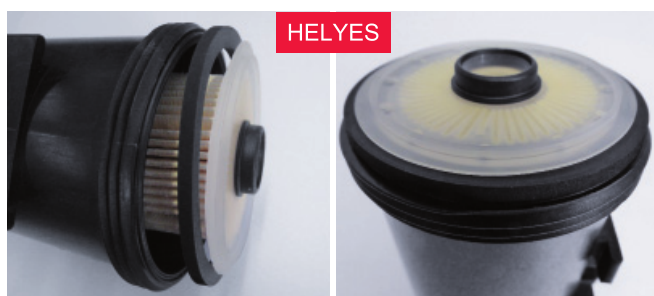
2. ábra: helyes sorrend