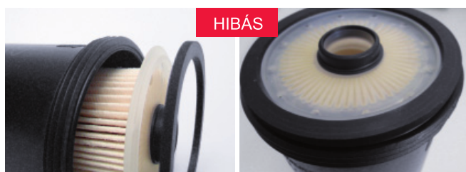
1. ábra: hibás sorrend

Tippünk: minden szűrőcsere alkalmával győződjön meg arról, hogy a tömítőgyűrű megfelelően a helyén van!