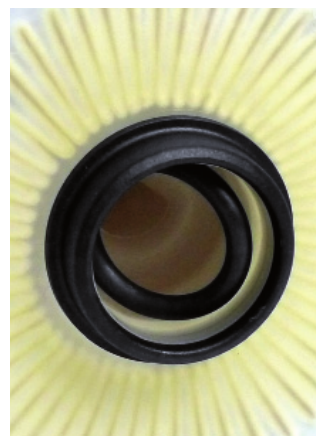
4. ábra: szűrőbe csúszott tömítés