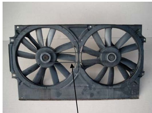
2-es ábr: PJ szíj

Amennyiben kiegészítő hűtés szükséges (légkondicionálóval szerelt autókban, gyári vonóhorog esetén, Taxi kivitelnél stb.) egy második ventilátor is felszerelésre kerül, hogy több levegő áramoljon a hűtőegységen keresztül. Ezt a második ventilátort hajtja 2 vagy 3 bordás PJ szíj.