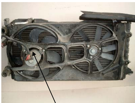
1-es ábr: El. motorral hajtott ventilátor

A közelmúltban ezek az szíjak autóiipari felhasználásokban is szerepet kaptak, ahol a fő alkalmazási terület a ventilátorok hajtása. Általában a hagyományos építésű motorokban 1 db elektro motorral hajtott ventilátorról beszélhetünk. (A rendszer a hűtőre szerelve) (1-es ábra)