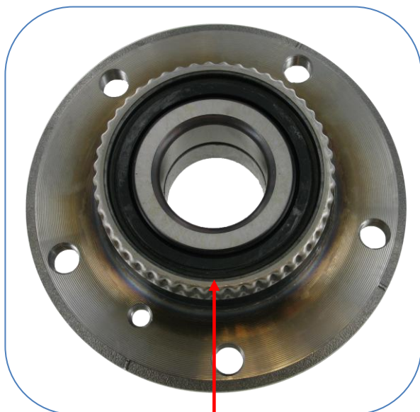
A/M kialakítás – Gumi tömítés

A gyártói (OE) előírásoknak és a tökéletes tömítettség biztosítása céljából az SKF csapágy belső oldalán fém porvédős tömítés található.