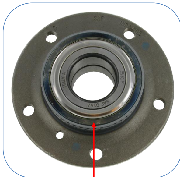
SKF kialakítás – Fém porvédőstömítés