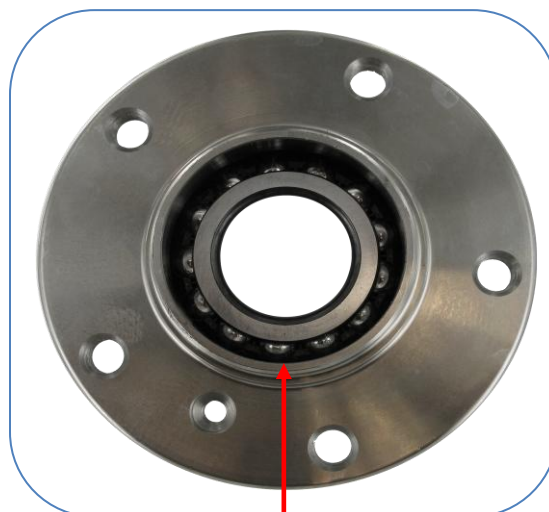
SKF kialakítás - külső oldali tömítés nélkül