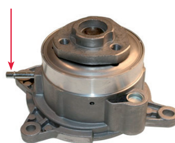
1. ábra: 65482 vákuum-szabályozás