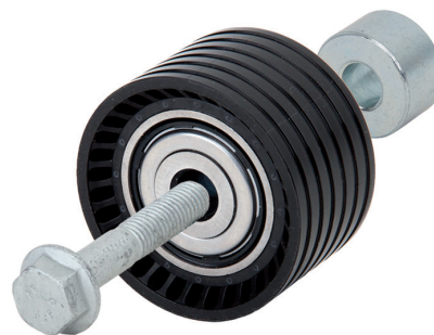
2. ábra: 55633 – Átvezető görgő az új tömítési elképzeléssel és rászertelt alkatrészekkel

Az összes ábrázolt kivitelezés megfelel a műszaki specifikációknak és korlátlanul használható.