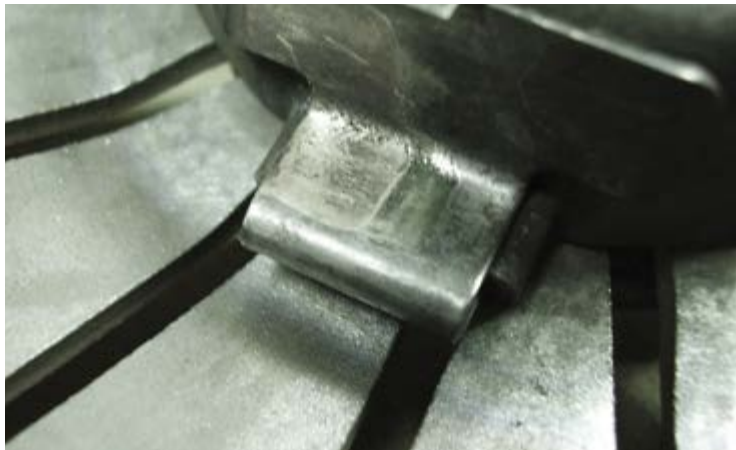
4. ábra: Kinyomócsapágy a kinyomóvilla felfekvésének a területén lévő deformációval

A kuplung cseréjekor kiegészítőleg meg kell vizsgálni az eddig használt kuplungszerkezet tányérrugójának az esetleges sérüléseit. Az 5. ábra példaként egy olyan tányérrugót mutat, amely a forgattyústengely nem megfelelő rezgésszigetelése miatt a kuplungházon belül ütközésig elfordult és ott bedolgozta magát. A hibaképet a forgattyústengely ékszíjtárcsájának a hibás csillapítója okozta. Ilyen esetben előnyös egy új csillapító beszerelése.