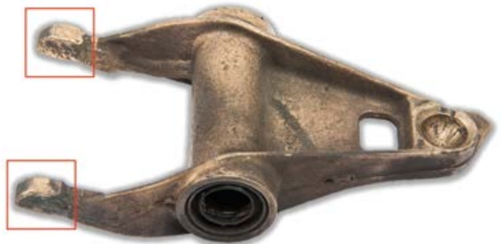
2. ábra: Az elkoptott kinyomóvillát ki kell cserélni

A kuplung rángatását nem a kéttömögű lendkerék (DMF) okozza. Ennek a kicserélése nem szünteti meg a hibát!