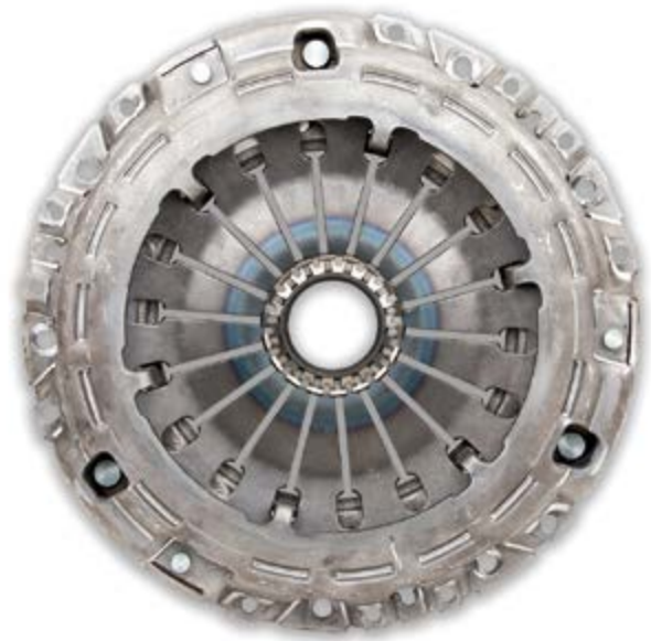
1. ábra: Egy húzott kuplungszerkezet

Ezért rángató kuplung esetén elsőként még beszerelt állapotban kell a kinyomóvilla kopásképét ellenőrizni. Ennél ügyeljene arra, hogy a kinyomóvillának a kinyomócsapággal érintkező felületei a sebességváltó felőli oldalon találhatóak. Ezért ezeket csak egy tükör segítségével lehet ellenőrizni.