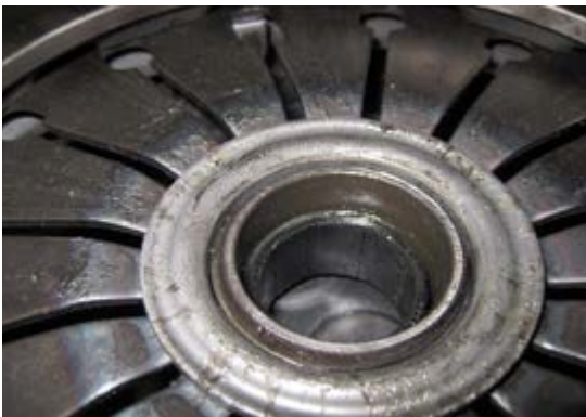
3. ábra: A kinyomócsapágy rögzítőgyűrűje

Az új kuplung beszereléskor nem szabad a kinyomócsapágy rögzítőgyűrűjét (3. ábra) beszírozni, mert a kenőanyag a súrlódó felületre kerülhet és a kuplung rángatásához/csúszásához vezethet!