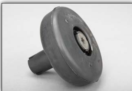
2. ábra: Lengéscsillapító

Lengéscsillapító nélküli járműveket a 24459603 cikkszámú (2. ábra) OE alkatrészsel lehet utólagosan felszerelni!