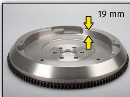
1. ábra: OE sz.: 90536140/616169 körbefutó bemélyedés nélkül, lendkerék mélysége 19 mm

Amennyiben hivatkozás történik a járműgyártó alkatrészszámára, akkor az csak összehasonlításra szolgál.