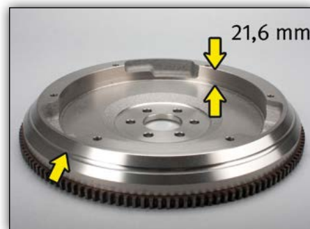
2. ábra: OE sz.: 93186460/5616016 körbefutó bemélyedéssel, lendkerék mélysége 21,6 mm

A 20KC2904 motorszámgig azokat a járműveket, amelyek ugyanezt a hibát mutatták, egy műhelyintézkedés keretében szintén ezzel az alkatrészszel alakították át és a sebességváltón egy zöld ponttal jelölték meg (lásd 3. ábra).