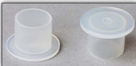
2. ábra: Záródugók

Annak érdekében, hogy a sebességváltó kiszerezésénél elkerülje az olajvesztést, minden LuK DMF ill. LuK RepSet®2CT csomagba két záródugót mellékelnek. Ezeket a sebességváltó beszerelt állapotában a mechatronika és a sebességváltó fekete szellőzőkupakjának a helyére kell beszerelni (1. ábra). A beszerelés után mindkét záródugót el kell távolítani és a szellőzőkupakokat újra fel kell szerelni.