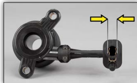
2. ábra: LuK CSC 510 0097 10 Hidraulikacsatlakozás 13,3 mm