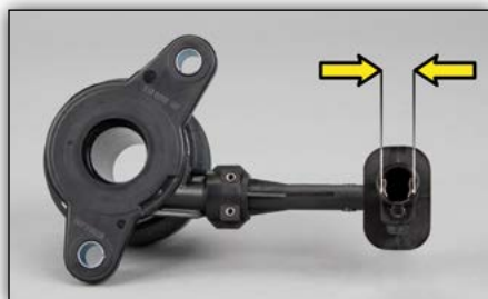
1. ábra: LuK CSC 510 0090 10 Hidraulikacsatlakozás 12,2 mm

Cikksz.: 510 0090 10 510 0097 10 510 0098 10 510 0137 10