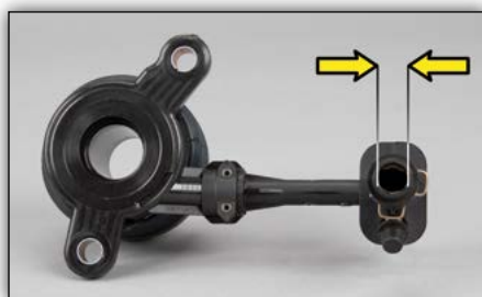
3. ábra: LuK CSC 510 0098 10 Hidraulikacsatlakozás 11,7 mm