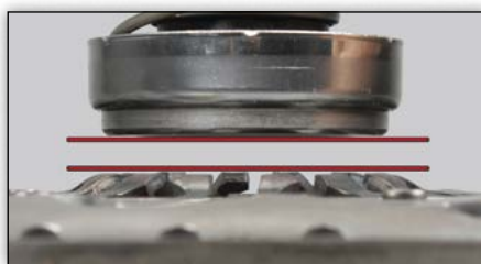
3. ábra: helyes beszerelés

Szakszerű beszerelés esetén minden tányérrugó csúcsa egy síkban fekszik. A kinyomócsapágy egyenletes terhelést kap. A kuplung működése biztosított.