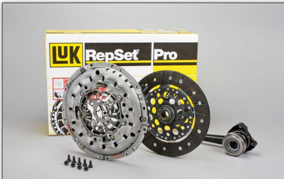
1. ábra: 623 3105 33 LuK RepSet® Pro

A LuK SAC tengelykapcsoló automatikus utánállítása miatt a szereléskor mindig a nyomólap ellenerő nélküli rögzítése szükséges.