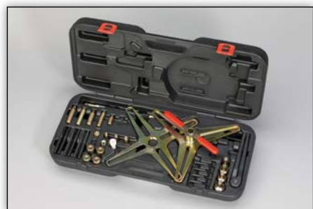
2. ábra: SAC szerszámkoffer 400 0237 10

A SAC szerszám a LuK-tól lehetővé teszi az ellenerő nélküli szerelést és ezért elengedhetetlen.