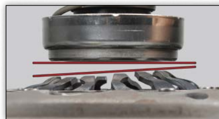
4. ábra: téves beszerelés

Szakszerűtlen beszerelés esetén a tányérrugók csúcsai nem azonos szinten állnak. Ezáltal megszorul a kinyomócsapágy a tányérrugóban. A kuplung működése korlátozott.