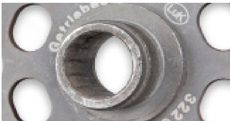
2. ábra: Sérült agyprofil

Ezáltal korlátozódik a DMF működőképessége. A motor minden forgási lengése csillapítatlanul átterül a hajtásláncre. Ez zajt és idő előtti kopást okoz. Egyedi esetekben a kuplungtárcsa agyprofilja úgy megsérülhet, hogy már nem lehetséges az erőátvitel (lásd 2. ábra).