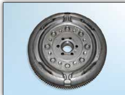
7. ábra: Motor oldal körbefutó bemélyedés nélkül a Sachs ZMS-nél