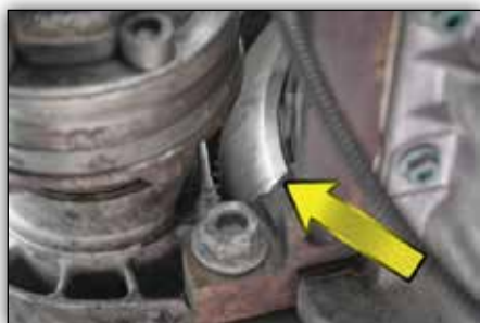
3. ábra: A takarólemez leszerelése után válnak láthatóvá a megkülönböztető jellemzők.

A 4.-7. ábrák a két kettős tömegű lendrék megkülönböztető jegyeit mutatják be. Ezek beszerelt állapotban a váltóharangon lévő ablakon keresztül ismerhető fel (lásd 3. ábra).