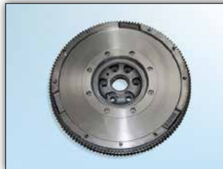
5. ábra: Sebességváltó-oldal Sachs ZMS esetén