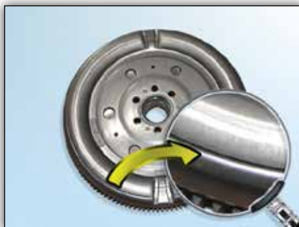
6. ábra: Motor oldal körbefutó bemélyedéssel az LuK ZMS-nél