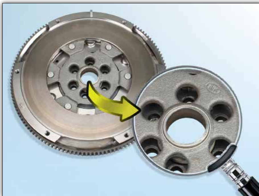
1. ábra: 415 0059 10 cikkszámú LuK ZMS (kettős tömegű lendkerék) siklócsapággal

A fent felsorolt járművek Luk- vagy Sachs kettős tömegű lendkerékkel (ZMS) lehetnek szerelve. Mindkét ZMS konstrukciójában különbözik egymástól és nem lehet azokat minden további nélkül összehasonlítani.