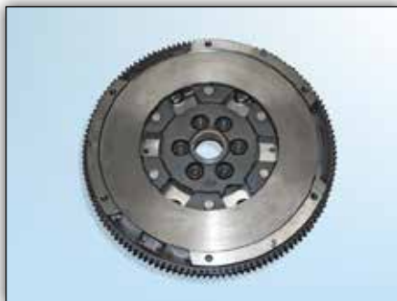
4. ábra: Sebességváltó-oldal LuK ZMS esetén