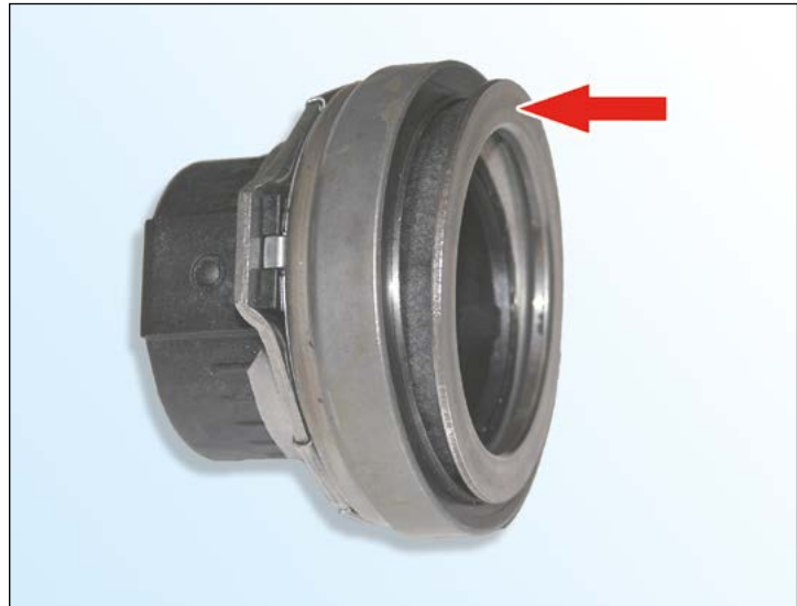
1. ábra: 500 0035 10